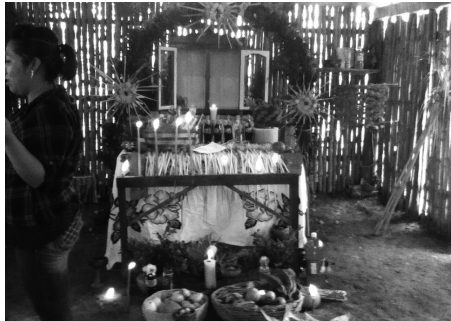
Tlaixpan: Xochicalco campa momahuiztilia Chicomexochitl (2012)