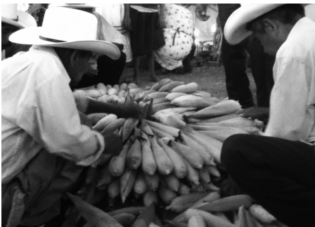
Elotlamanah: quicualtlalah elotl campa quitlatlalhuilizceh (2012)