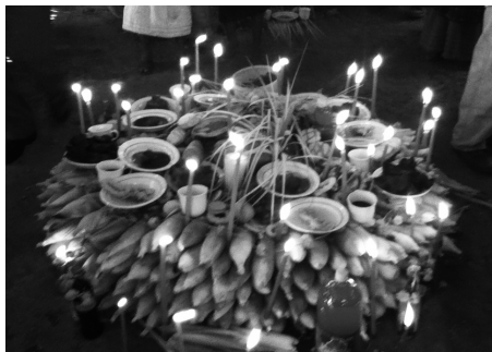
Elotlamanah: elotl quitlatlalhuiltoqueh (2012)