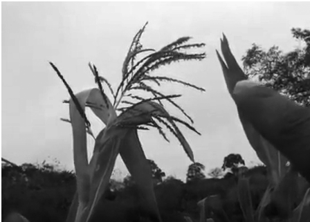
Miyahuatl: cintli ixochiyo (2012)